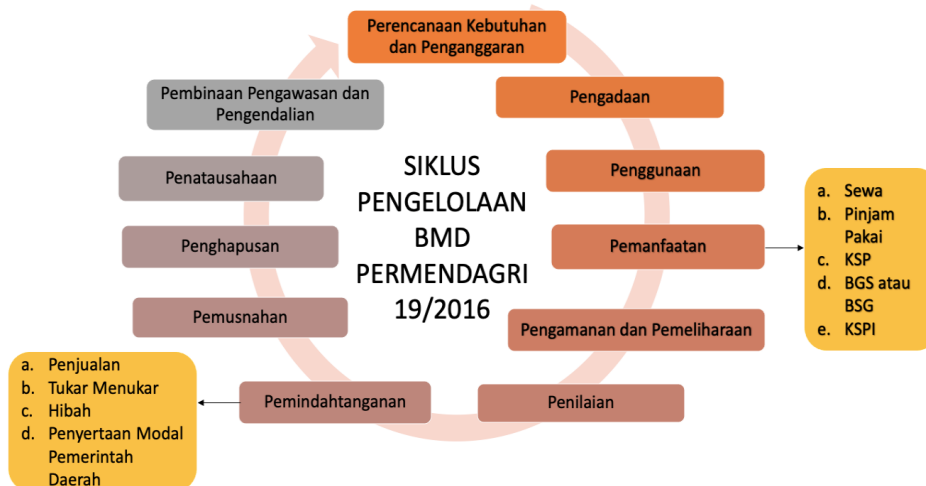
Gambar 1. Siklus Pengelolaan BMD

IKATAN AKUNTAN INDONESIA KOMPARTEMEN AKUNTAN PENDIDIK